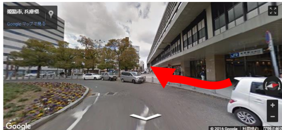
姫路駅「南口」を出て西方向へ約50m

お席には限りがございますのでご希望通りご乗車 いただけない場合もございますので予めご了承ください